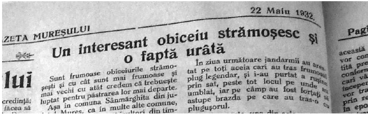
1. Extras din Gazeta Mureșului, 22 mai 1932